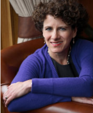
Susan Pinker, autora do livro

Em seu livro "O Paradoxo Sexual: hormônios, genes e carreira", lançado recentemente no Brasil, Susan dissecou o organismo, a mente e o DNA femininos para mostrar por que elas simplesmente optam por carreiras e vidas de menores fortunas - e, ainda assim, são mais realizadas do que os homens. “Durante a última década, houve uma mudança na economia, de um foco exclusivo na aferição de riquezas para uma análise do que impulsiona a longevidade, a satisfação e a felicidade”, escreve Susan em seu livro.